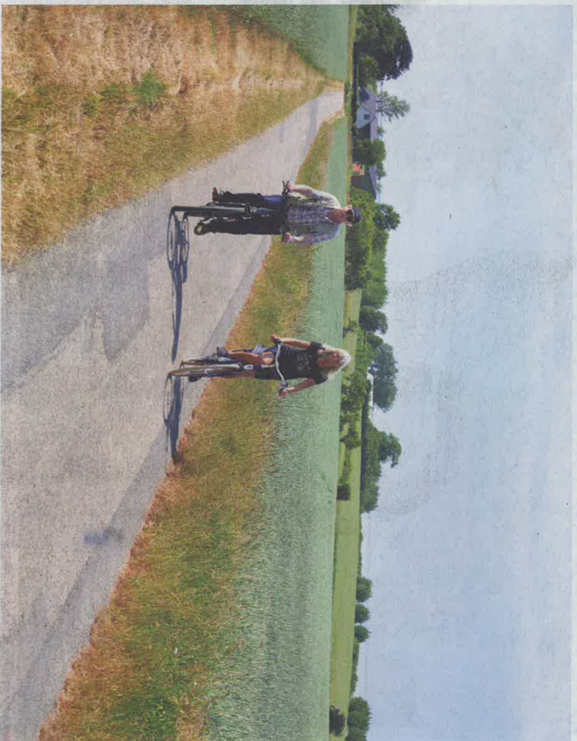
Femø er perfekt til cykelture som her på Gåsemoosevej. Der er ikke mange biler, og øens højeste punkt, Issemose Bjerg, er 22 meter. Femø ligger i Smålandshavet en times sejlads nordøst for Krageas på Lolland